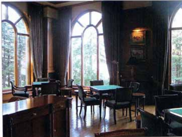
Внутри — благородная колониальная обстановка

отелям. Но Oberoi — это скорее анахронизм. Поэтому в Дели — я в Oberoi. Легкий массаж, бассейн, затем специальный сотрудник вызывает мне недорогое такси, объясняет ценовую политику и дает адреса правильных мест. И я покупаю одежду и белье из прекрасного индийского хлопка Apokhi и целую корзину баночек с разнообразными чатни Fabindia Organic, дальше — немножко дешевых индийских изумрудов (за 300 долларов можно купить гарнитур — серьги и кольцо: золото, изумруд, рубин и мелкие бриллианты). Понятно, что они не так уж ценятся на рынке, но в некоторых местах, где ювелиры точно копируют работы старых мастеров, вещи изысканны и кажутся необычными. Кстати, в Oberoi Delhi восхитительнейший магазин. Цены там, конечно, другие. Но если вы можете себе позволить сделать любимому человеку дорогой подарок в районе тысячи-двух долларов, то там можно найти такие штучки, от которых просто сойдешь с ума. А цены раз в 5 меньше, чем в Европе. И качество здесь гаранти-