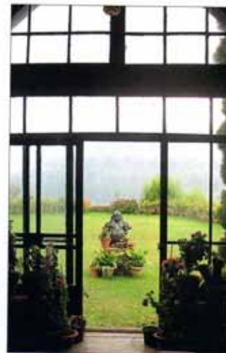
В такой обстановке трудно не почувствовать себя богатым белым сахибом